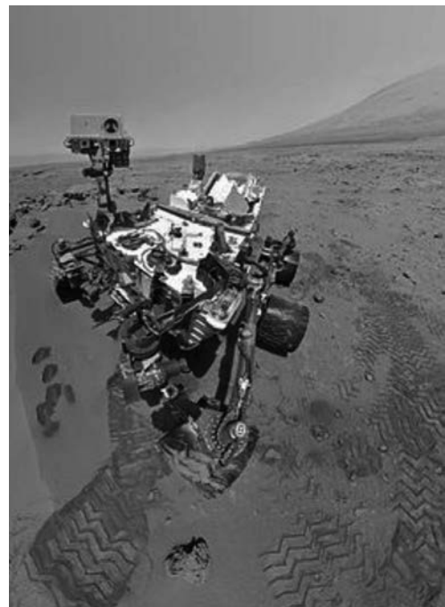
Imatge del Curiosity al cràter Gale, a la superfície de Mart (31 d'octubre de 2012)

DADES: Massa de Mart, M_{\text{Mart}} = 6,42 \times 10^{23}\text{ kg} . Radi de Mart, R_{\text{Mart}} = 3,39 \times 10^6\text{ m} . G = 6,67 \times 10^{-11}\text{ N m}^2\text{ kg}^{-2} .