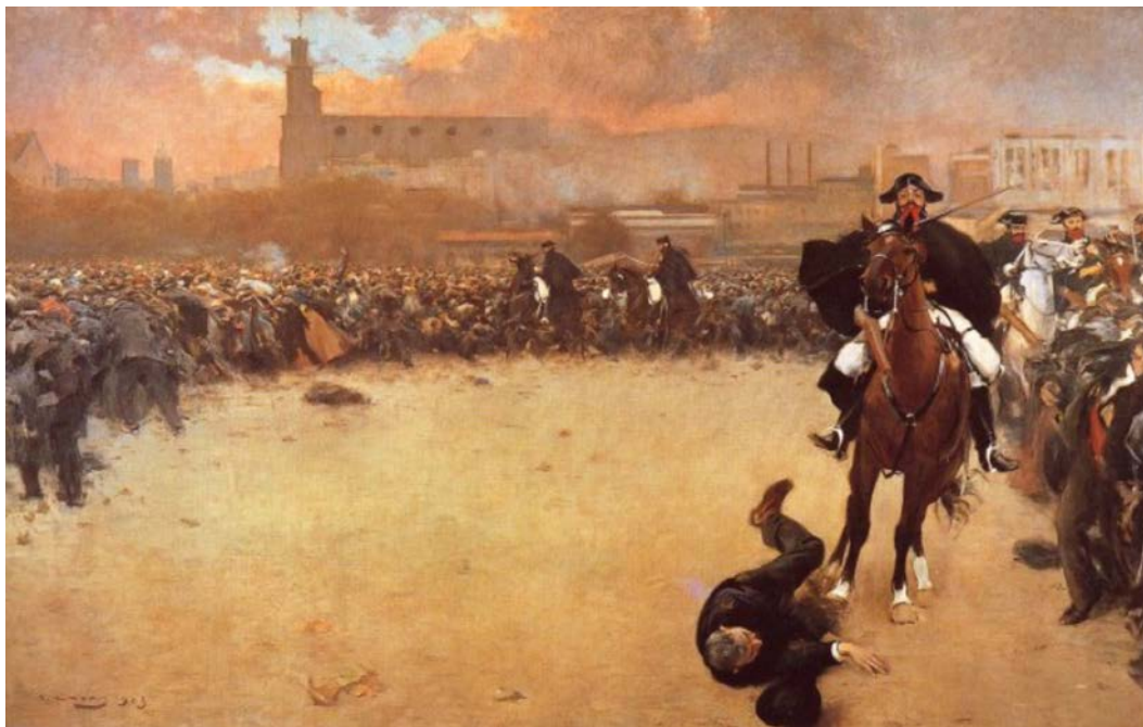
La càrrega o Barcelona 1902

FONT: Ramon Casas, 1899 (Museu de la Garrotxa, Olot).