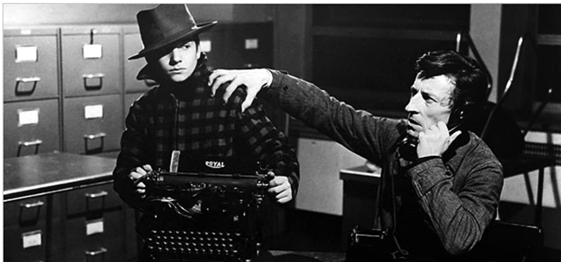
Fotograma de Les quatre cents coups (1959), de François Truffaut.

Observeu atentament el fotograma següent de la pel·lícula Les quatre cents coups (1959), de François Truffaut, i responeu a les qüestions 2.1, 2.2 i 2.3.