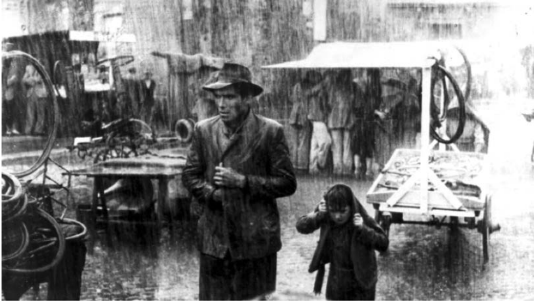
Fotograma d' El lladre de bicicletes (1948), de Vittorio de Sica.

Observeu atentament el fotograma següent de la pel·lícula El lladre de bicicletes (1948), de Vittorio de Sica, i responeu a les qüestions 2.1, 2.2 i 2.3.