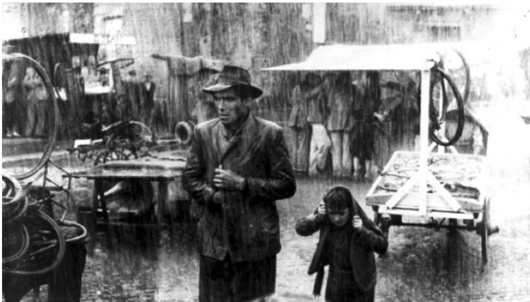
Fotograma d' El lladre de bicicletes (1948), de Vittorio de Sica.

Observeu atentament el fotograma següent de la pel·lícula El lladre de bicicletes (1948), de Vittorio de Sica, i responeu a les qüestions 2.1, 2.2 i 2.3.