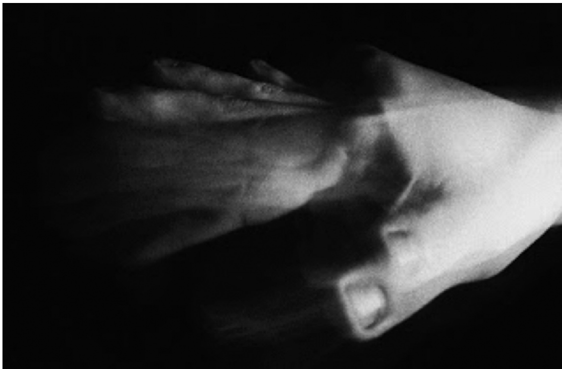
Manos , Felipe Vargas Figueroa, 2013.

Observeu atentament la fotografia següent, obra del fotògraf Felipe Vargas Figueroa, i responeu a les qüestions 2.1, 2.2 i 2.3.