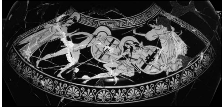
Ceràmica de figures vermelles (500-450 aC), Museu Gregorià Etrusc del Vaticà (Roma)

Aquesta imatge mostra la mort d'Hèctor. Feu una redacció (entre cent cinquanta i dues-centes paraules) en què expliqueu com es produeix aquest fet segons la narració de la Iliada . El vostre text ha de donar resposta a les preguntes següents: