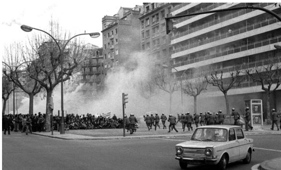
Manifestació proamnistia a Barcelona. FONT: Manel Armengol, 1976.